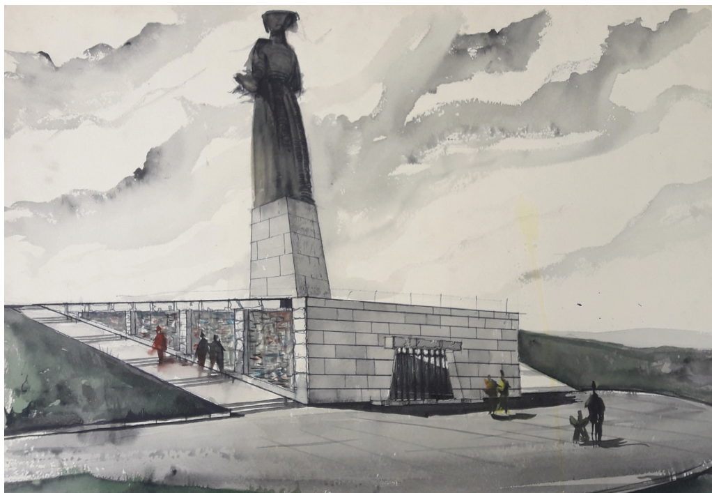
2 il. Memorialo „Tarybinei armijai“ Kryžkalnyje eskizas, 1967–1970 m.

Raseinių apylinkėse iš tikrųjų vyko mūšiai, kuriuose dalyvavo 16-oji lietuviškoji šaulių divizija, taigi memorialo vieta buvo susieta su autentiškų kovų vieta. Memorialui su monumentaliu paminklu palankus buvo ir kraštovaizdis – plačios erdvės, kuriose galėjo atsiskleisti skulptūros siluetas. Skulptūros reikšmė šiek tiek pakito: perkelta iš Aleksejevkos į Lietuvą ji turėjo išsakyti padėką ne vien 16-ajai lietuviškajai šaulių divizijai, bet ir suteikti bendresnę – dėkingumo visiems tarybiniais kariais, „vadavusiems“ Lietuvą, reikšmę.