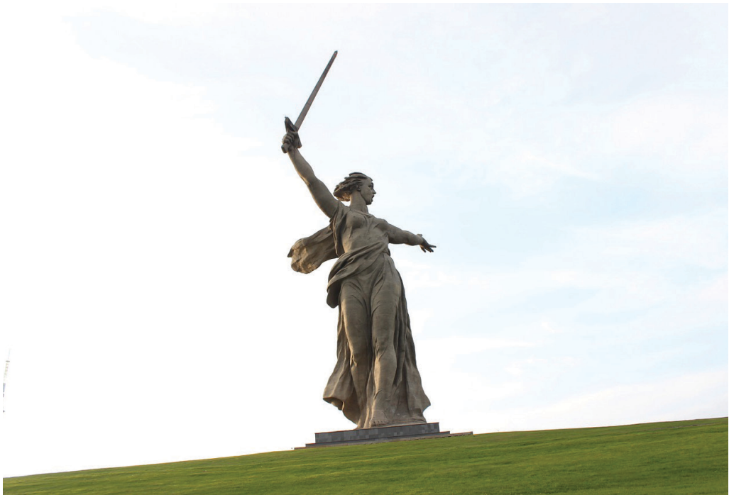
6 il. „Tėvynė motina šaukia!“. Volgogradas, 1981.

Tai, kad į Kryžkalnio motinos monumentą (bent jau) vietos gyventojai žvelgė neutraliai ar santykinai palankiai, liudija jų folkloras. Raseiniškiai jai buvo priskyre Raseinių Magdės – daugiareikšmės miesto legendos, kurią, kaip žinia, išgarsino 1909 m. parašyta Maironio poema tuo pačiu pavadinimu, vardą 54 . Vadinta Kryžkalnio motina ir kitu moderniai skambančiu vardu – „Monika“, spėčiau, siekiant pabrėžti objekto išskirtinumą, kitoniškumą, kaip ir vardas „Magdalena“ (rengiant spaudai šį straipsnį, autoriaus kalbinti kai kurie vyresnės kartos raseiniškiai negalėjo paaiškinti, kodėl ir kaip atsirado vardas Monika, kelta versija, kad toks buvo skulptoriaus žmonos vardas, o ji buvusi Kryžkalnio motinos prototipu).