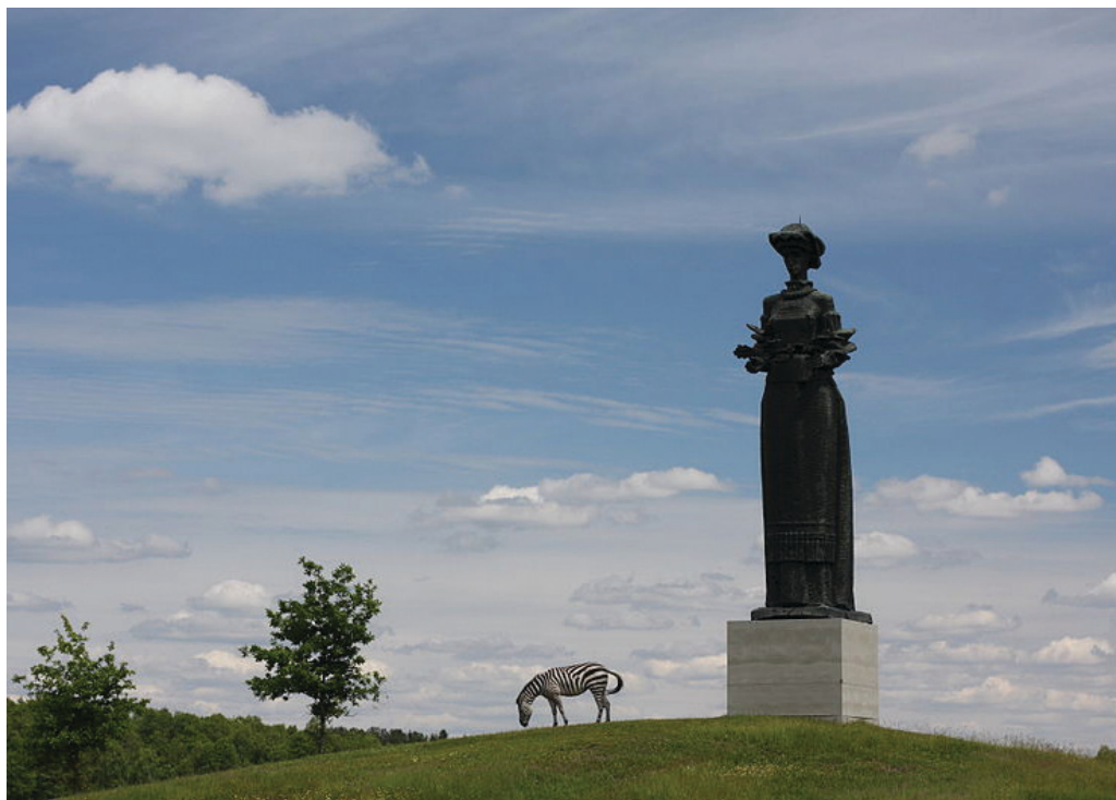
9 il. Monumentas „Tarybinei armijai“. Grūtas, 2012 m.

žvelgti per humoro prizmę, kas neišvengiamai reiškė sovietmečio istorijos profanavimą (tai, ko, panašu, norėjo išvengti LGGRTC), dirbtinį distancijos tarp sovietinės epochos ir žmonių nustatymą, tarsi teigiant, kad tai, ką matome Grūte, su „mumis“ nieko bendra neturi, ir apskritai siekį sukurti intriguojančią erdvę.