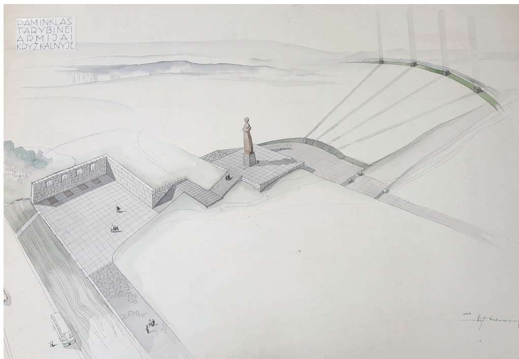
3 il. Monumento „Tarybinei armijai“ Kryžkalnyje eskizas, 1967–1970 m. Vilniaus regioninis valstybės archyvas.

Įdomu pastebėti, kad, regis, statyti paminklą Kryžkalnyje (kelių sankryžoje) buvo nuspręsta tik šio posėdžio metu. Iki tol planuota statyti kitą atminimo ženklą: paminklą lietuvių ir baltarusių partizanams Lietuvos ir Baltarusijos pasienyje 39 .