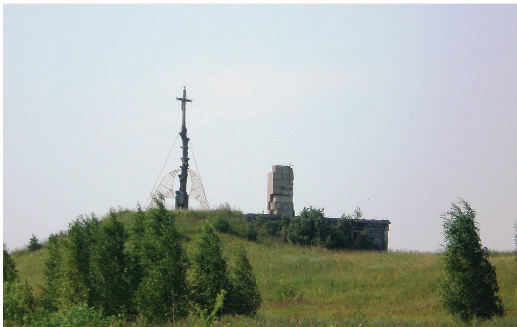
11 il. Kryžius prie buvusio monumento „Tarybinei armijai“ postamento. Kryžkalnis, 2011 m.

investuoti į nacionalinio memorialo „visiems žuvusiems Lietuvos partizanams“ statybas netoliese 111 .