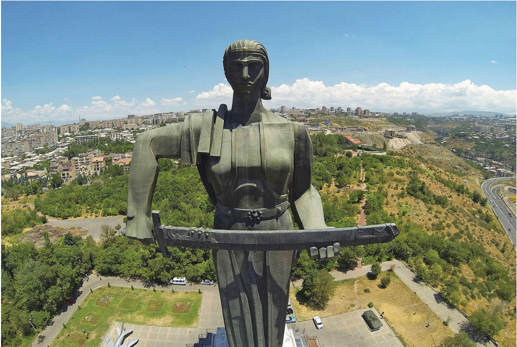
5 il. Motina „Armėnija“. Jerevanas, 1967. „Wikipedia“.

Kad ir kaip būtų, „Maskvos generolų“ aistros, jei jų ir būta, buvo nuramintos, ir Kryžkalnio memorialas ėmė funkcionuoti kaip numatyta – čia minėtos svarbios SSRS (Lietuvos SSR) datos, vyko priėmimo į pionierius ir komjaunimą ceremonijos, fotografuodavosi jaunavedžiai, lankydavosi ekskursantai. 1973 m. memorialo autoriai buvo apdovanoti Lietuvos SSR Valstybine premija, o tai reiškė, kad šis objektas ir menine, ir ideologine prasme (pa)tiko Lietuvos SSR valdantiejiems sluoksniams.