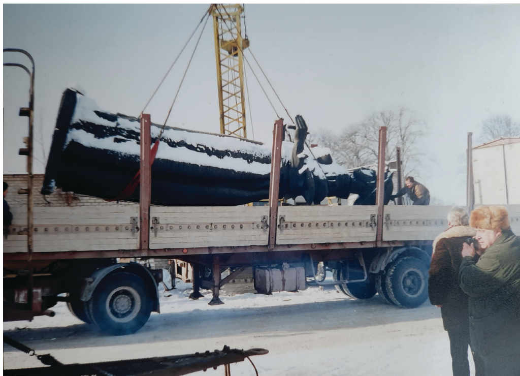
8 il. Monumento „Tarybinei armijai“ kelionė į Grūtą, 1999 m.

tikintis, jog anksčiau ar vėliau Vyriausybė imsis tarybinių skulptūrų ekspozicijos steigimo klausimo 85 .