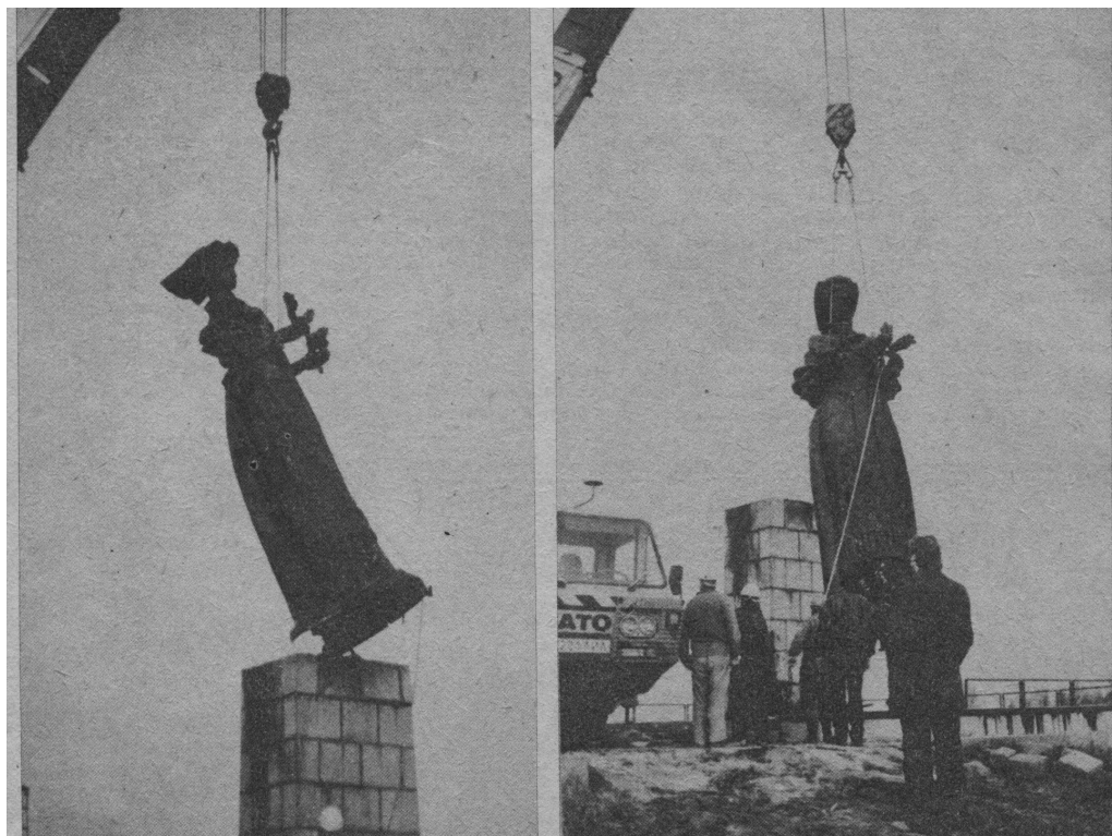
7 il. Kryžkalnio monumento nukėlimas 1990 m. spalio 25 d. „Naujas rytas“.

Sprendimas, suprantama, buvo žinomas iš anksto, nes skulptūra buvo fiziškai pašalinta praėjus pusvalandžiui nuo (sic!) nuo sprendimo priėmimo. Motyvuota galimais pavojais, jei skulptūra griūtų.