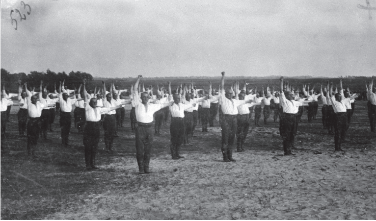
3 il. Lietuvos kariuomenės 1-ojo pėstininkų Lietuvos Didžiojo Kunigaikščio Gedimino pulko kariai atlieka gimnastikos pratimus, 1927 m.

1926 m. pažymėta, kad Lietuvos kariuomenė (3–4 pav.) naudoja „sakalų mankštą“, tačiau atkreiptas dėmesys, kad tarp kariuomenės ir sokolų būta daug skirtumų: „Sakalai – tai visuomenės organizacijos nariai, susirišę viena bendra idėja, draugišku visuotiniu solidarumu ir, pagaliau, tvirtu klusnumu bei drausme. <...> Sakalai yra išsidirbę ne tik savo sistemą gimnastikoje, bet ir savo rikiuotės būdus <...>. Visos sakalų mankštos yra aiškiai matyti: vyrai sakalai sveikos nuotaikos, gražaus kūno sudėjimo, tvirta, drąsia eisena; merginos – lieknos, vikrios, linksmo būdo, malonios nuotaikos ir, rasit, ne mažiau ištvėringos kaip vyrai. Sakalybė neša sveikatą, pasitikėjimą savimi ir optimizmo dvasią į plačias tautos mases. Sakalų organizacijose Čekuose vokiečiai ir madarai – žodžiu, ne slavai – nedalyvauja“ [20]. 1926 m. birželio 13 d. Karo mokyklos aikštėje surengta gimnastikos šventė Trimite apibūdinta – „graži buvo sakalų gimnastika“ [124, 758]. Žinoma, sakalų gimnastikos plitimui kariuomenėje įtakos turėjo ir tai, kad Lietuvos karininkai buvo siunčiami studijuoti į Čekoslovakijos aukštąsias karo mokyklas [39, 208–210]. Šauliai užsiiminėjo „sakalų gimnastika“ grojant orkestrui [33, 534; 30]. Nuo XX a. 3-iojo dešimtmečio antros pusės vadinamoji „sakalų gimnastika“ tampa įprastine šaulių veikla, Trimite nuolat publikuojant informaciją apie tokio pobūdžio užsiėmimus būriuose (1 ir 5 il.).