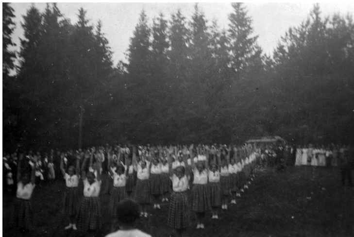
1 il. Šaulės sportininkės atlieka masinės gimnastikos pratimus šventės metu Rambyne. 1936 m.

XX a. 4-ojo deš. viduryje parengus naują LŠS statutą, teigta, kad „šauliams karo metu, galimas daiktas, daugiausia teks būti partizanais, tačiau partizanai taip pat turi laikytis kariškosios tvarkos. Jiems taip pat dažnai tenka, ginantis ar puolant priešą, užimti polijas, mokėti apsikasti, daryti perbėgintus, šaudyti į judantį tai-