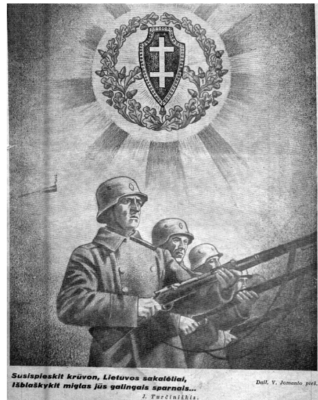
6 il. Plakatas, atspausdintas Trimito viršelyje, vaizduojantis LŠS kaip šviečiančią saulę, o šauliai (kurie įvardijami Lietuvos sakalėliais) pasirengę gynybai. Trimitas , 1936, birželio 25, Nr. 26, [viršelis]

1862 m. Sokol įkūrė Miroslav Tyrš (1832–1884 m.) ir Jindřich Fügner (1822–1865 m.) „kūno kultūrą panaudojo tautiniam sąjūdžiui