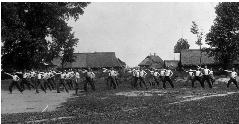
5 il. XIX Alytaus šaulių rinktinės ugniagesių kursų klausytojai atlieka masinės sportinės gimnastikos pratimus. 1930 m.