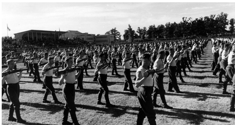
2 il. Kolektyviniai šaulių pratimai su šautuvais Lietuvos šaulių sąjungos dvidešimtmečio šventėje. 1939 m. birželis, Kaunas.