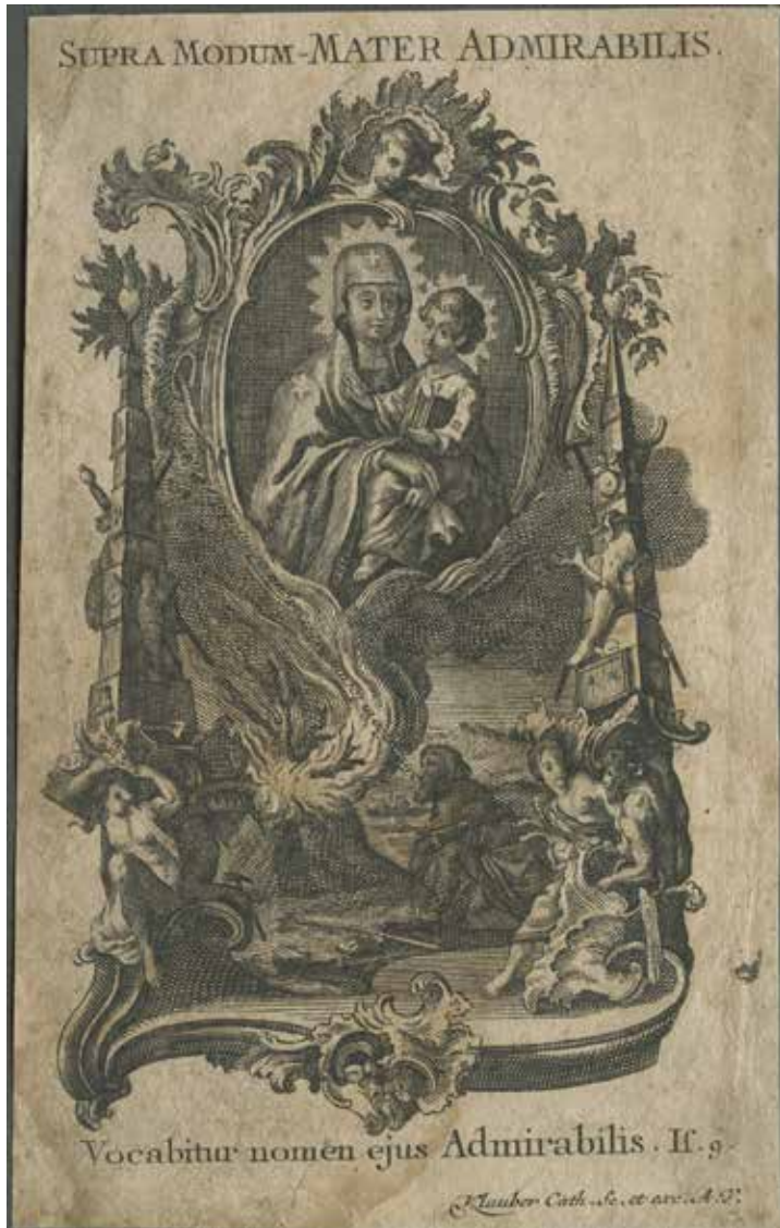
4. Johannas Baptistas, Josephas Sebastianas Klauberiai. „Supra Modum – Mater admirabilis“. Augsburgas, XVIII a. vid. Vario raiziny. ŽVM P 1955/4