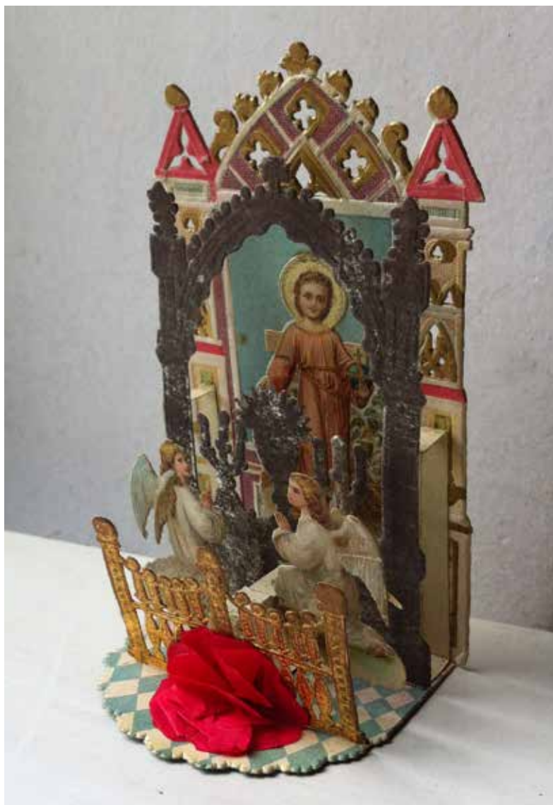
16. Išskleidžiamas paveikslėlis „Jėzus – pasaulio valdovas“. Než. leidėjas, XIX–XX a. sandūra. Chromolitografija, mišri technika. Privatus rinkinys