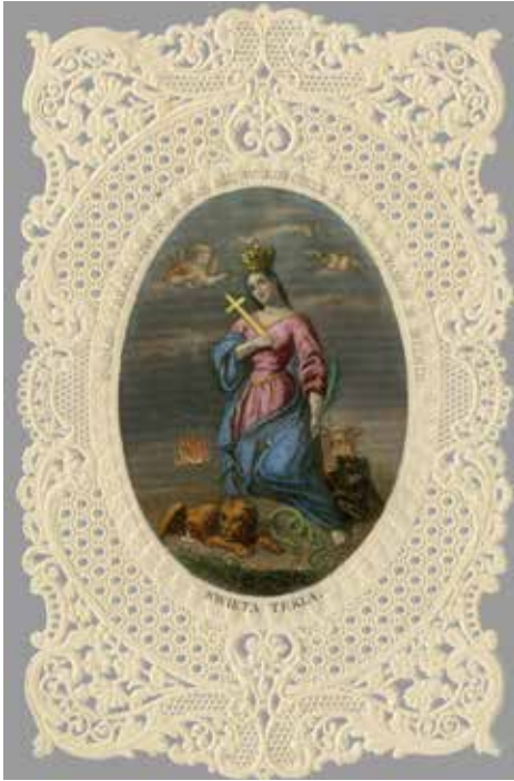
13. Antonis Oleszczyński. „Šv. Teklė“ (pagal Vilniaus Augustinų bažnyčios paveikslą). Leidėjas Jonas Kazimieras Vilčinskis, [1851–1852]. Spalvintas plieno raižinys, popieriaus „nėriniai“. VUM, G 91