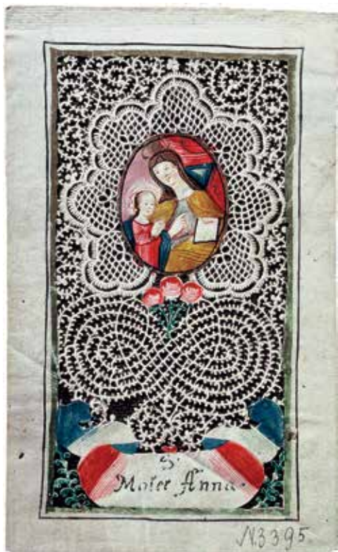
6. Než. meistras. Šv. Ona su Marija. Popieriaus karpinys, akvarelė. Vokietija, 1780–1800 m. https://nat.museum-digital.de/object/86705