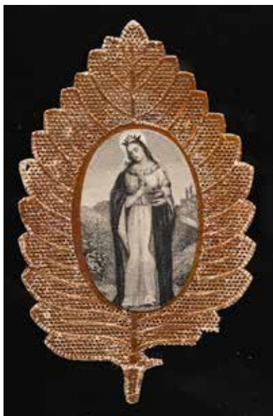
15. „Šv. Elžbieta Vengrė“. Leidėjas Franzas Schemmas (?). Niurnbergas (?), XIX a. II p. Plieno ražinys, popieriaus „nėriniai“. Kun. Mozės Mitkevičiaus rinkinys

ti atvaizdėli ant sudžiovinto lapo – tai senesnės, bent jau XVIII a. siekiančios, tradicijos aidas. Tačiau būtent XIX a. II p. suklesti medžio lapus imituojančių paveikslėlių gamyba, aiškėja ir jos arealas – pietinė Vokietija. Tokio tipo paveikslėlius leido: A. Schaufele'ė Štutgarte, [J.] Lutzenbergeris – Altetinge (Altötting), A. Götzas – Miunchene, Franzas Schemmas – Niurnberge (15 pav.). Sunku spėsti, kodėl perforuotas ar ažūrinis paveikslėlis turėjo priminti medžio lapo skeletą. Gal praeityje sodrų simbolinį klodą turėjusių kietųjų medžių ažuolo ar buko lapų skeletai (išgauti šepėčiu) mėgti vien dėl žavingo trapaus ažūro ir buvo tik dekoras? O galbūt reiškinio ištakas reikėtų sieti su piligrimystės fenomenu ir