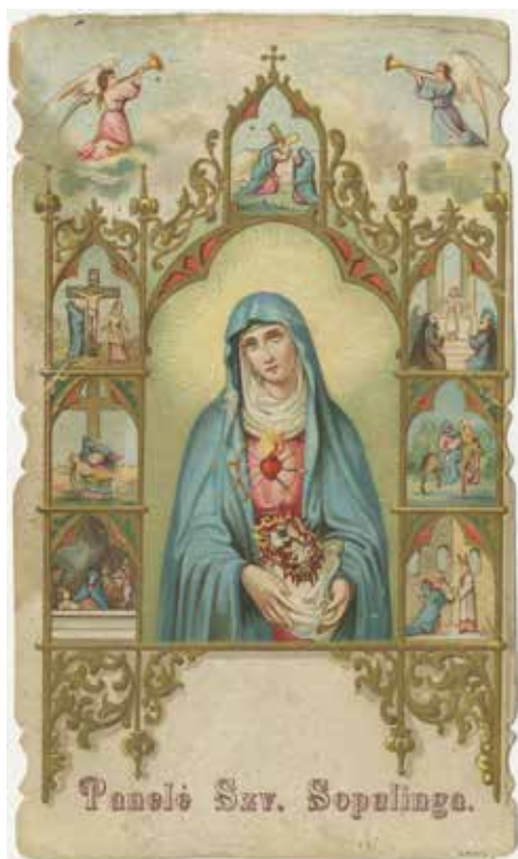
2. „Švč. Mergelė Sopolingoji“.