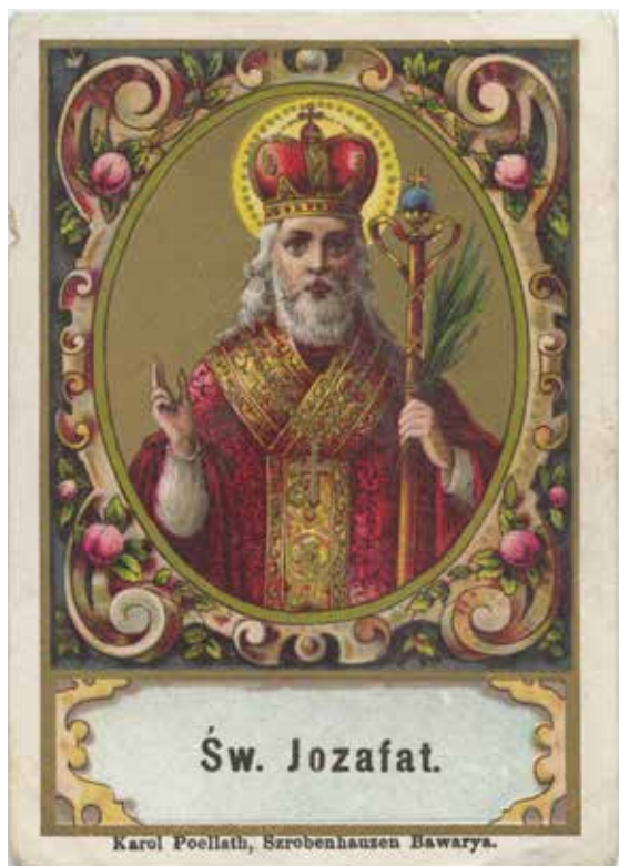
3. „Šv. Juozapas“.

Leidėjas Carlas Poellathas. Šrobenhauzenas, XIX a. pab.