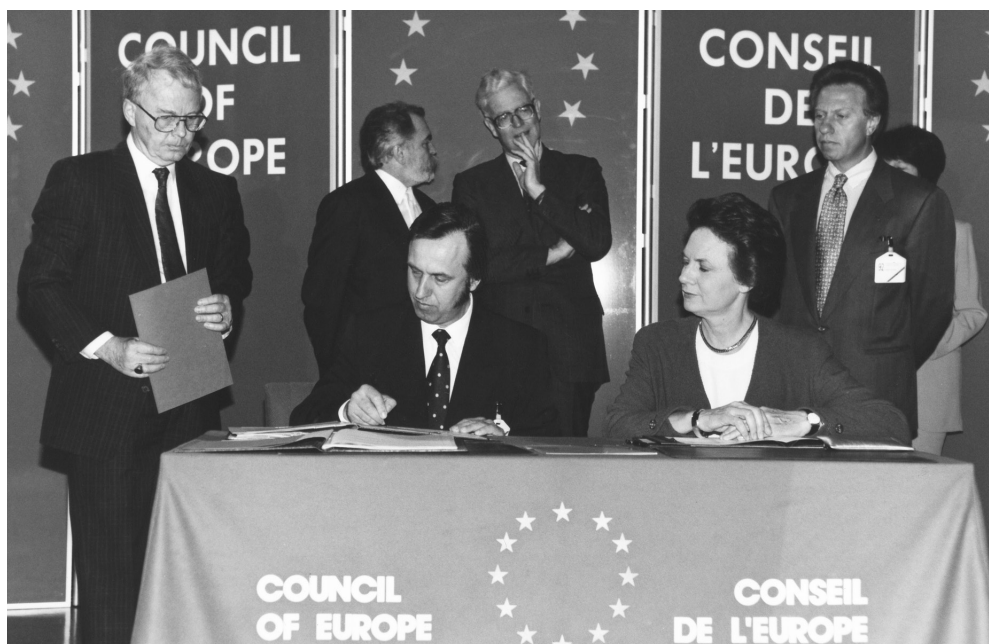
5. Republika Litewska staje się pełnoprawnym członkiem Rady Europy: minister spraw zagranicznych Povilas Gylys podpisuje Statut Rady Europy, obok – sekretarz generalna Rady Europy, Catherine Lalumiere. Strasburg, 14 maja 1993 r.