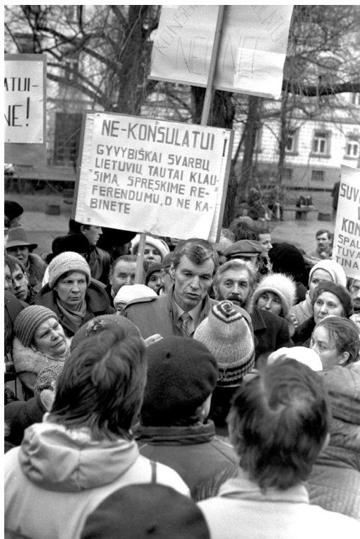
4. Pikieta przeciwko powołaniu polskiego konsulatu w Wilnie. Pod plakatem, w centrum, stoi Justas Paleckis – zastępca kierownika Wydziału Kontaktów Zagranicznych KC KPL. Wilno, 1989 r. [fot. P. Lileikis, LCVA]