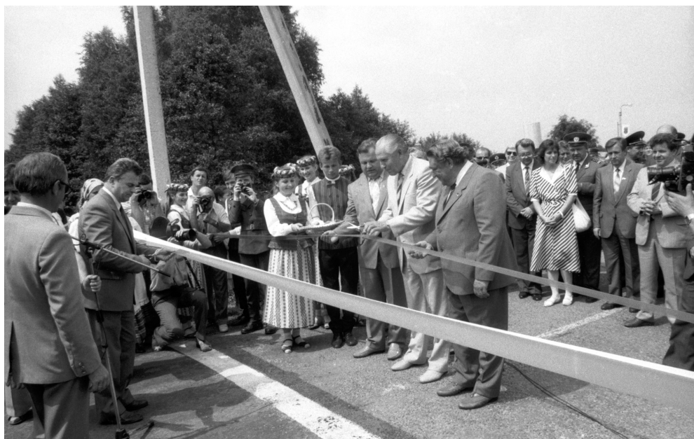
10. Otwarcie punktu kontroli celnej na granicy Litewskiej SRR i PRL, rejon łódziewski, 1988 r.