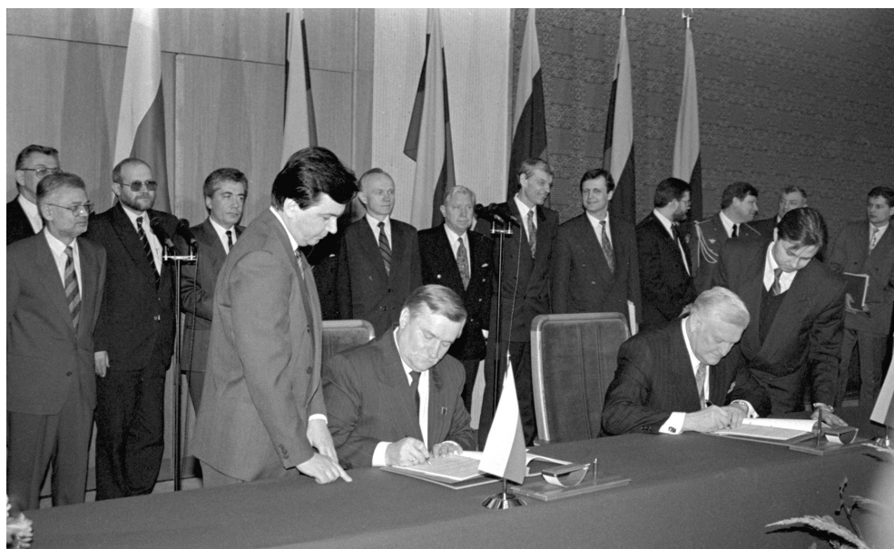
24. Prezydenci Litwy i Polski: Algirdas Brazauskas i Lech Wałęsa podpisują Traktat o przyjaznych stosunkach i dobrosąsiedzkiej współpracy między obu krajami, Wilno, 26 kwietnia 1994 r.