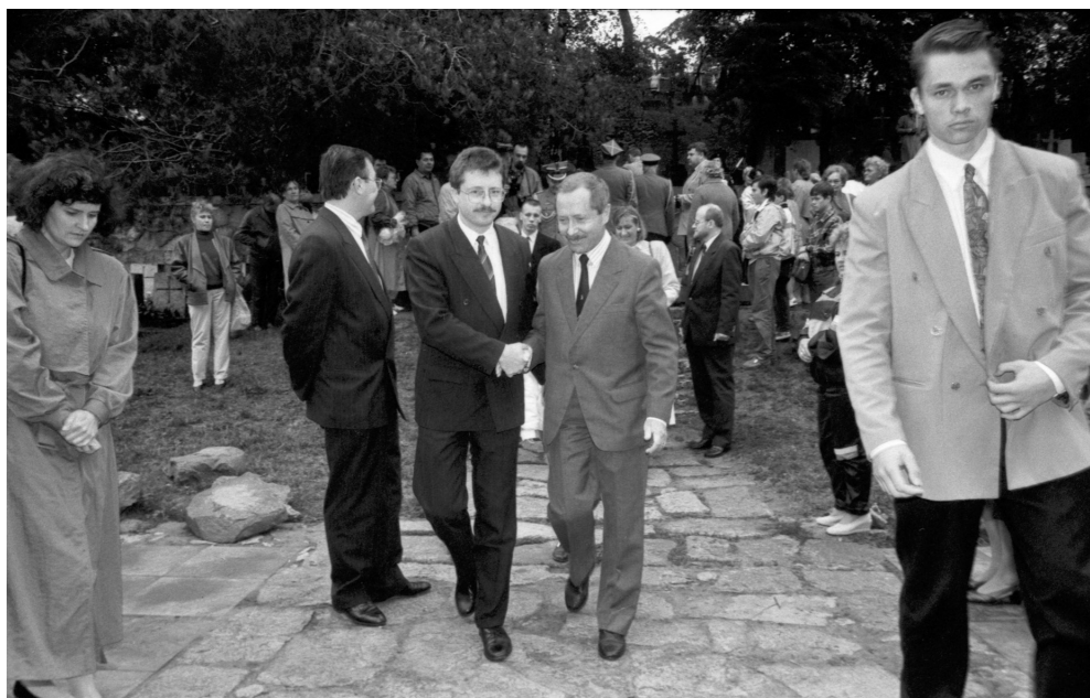
3. Audrius Butkevičius (minister obrony kraju RL) i Janusz Onyszkiewicz (minister obrony narodowej RP) w Wilnie na Cmentarzu Antokolskim w czerwcu 1993 r.