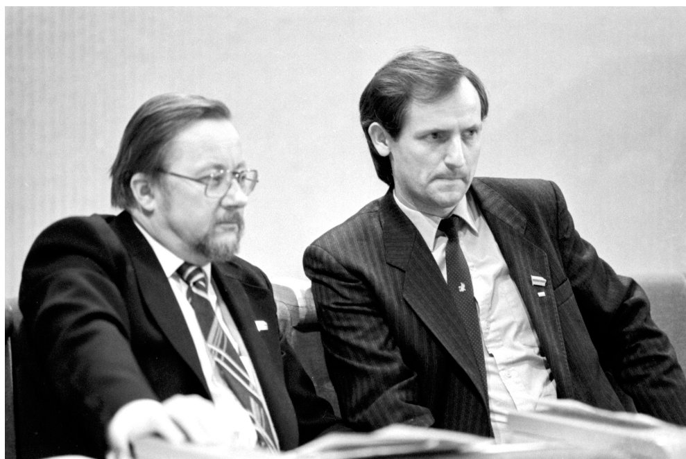
23. Przewodniczący litewskiej Rady Najwyższej – Vytautas Landsbergis i Czesław Okińczyc – deputowany to tej Rady, działacz Związku Polaków na Litwie, marzec 1990 r.