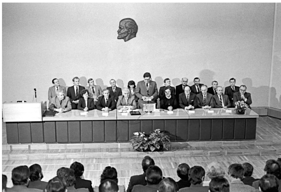
22. Podpisanie porozumienia o przyjaźni i rozwoju kontaktów między Litewską SRR a województwem suwalskim, Wilno 1988 r.