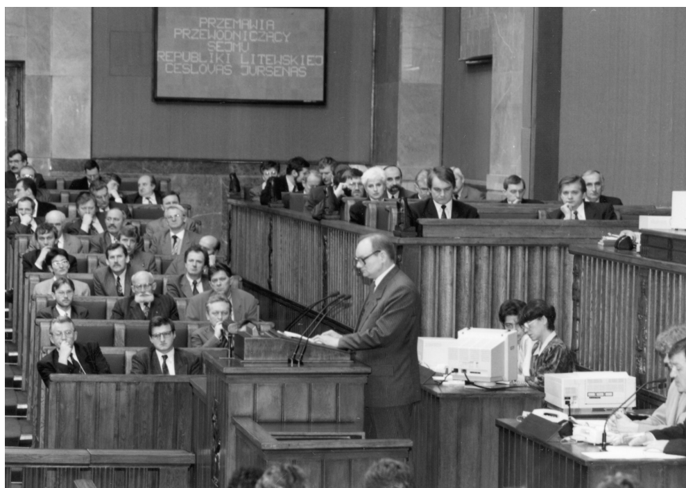
13. Przewodniczący sejmu litewskiego – Česlovas Juršėnas przemawia w polskim parlamencie, grudzień 1993 r.