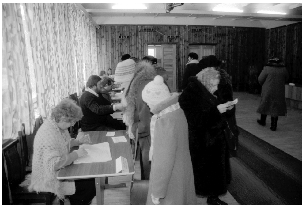
12. Głosowanie w „sondażu” 9 lutego 1991 r., Komisja Wyborcza nr 12 w Ejszyszkach, w rejonie sołecznickim