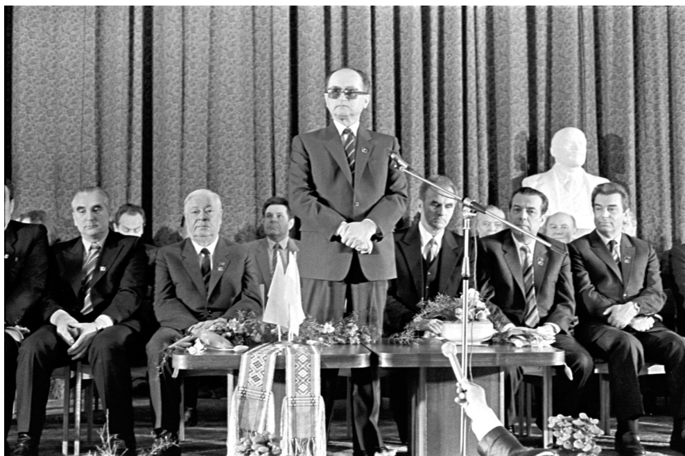
15. Delegacja Polskiej Zjednoczonej Partii Robotniczej w Instytucie Pedagogicznym w Wilnie, przy mikrofonie stoi Wojciech Jaruzelski, pierwszy z lewej siedzi pierwszy sekretarz KC KPL – Petras Griškevičius, 1986 r.