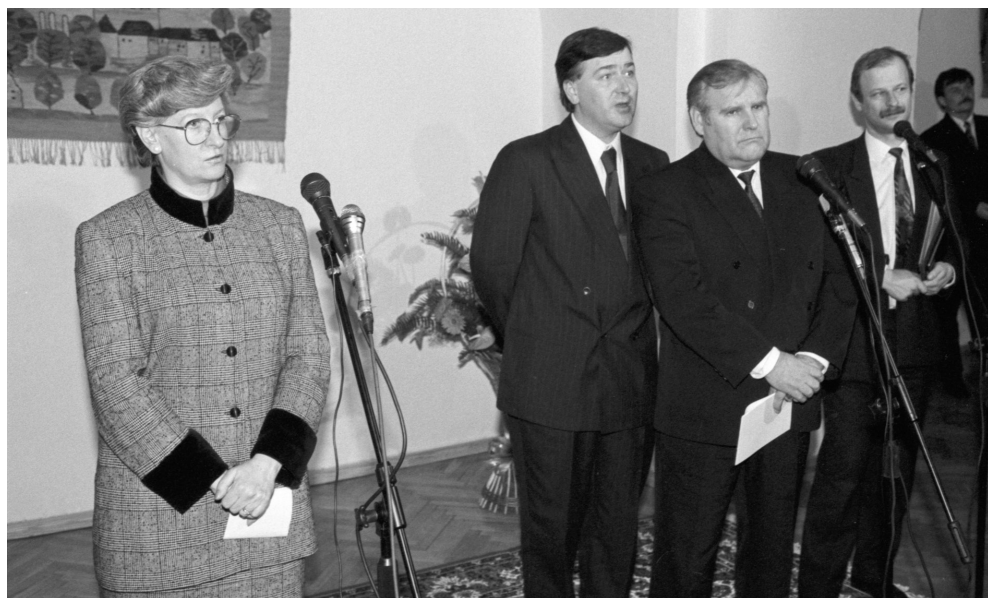
7. Premierzy Hanna Suchocka i Bronislovas Lubys na wspólnej konferencji prasowej po spotkaniu na Wigrach 7 stycznia 1993 r.