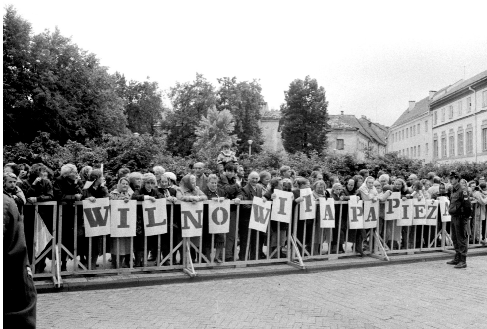
21. Polscy wierni witają Jana Pawła II w Wilnie, 5 września 1993 r.