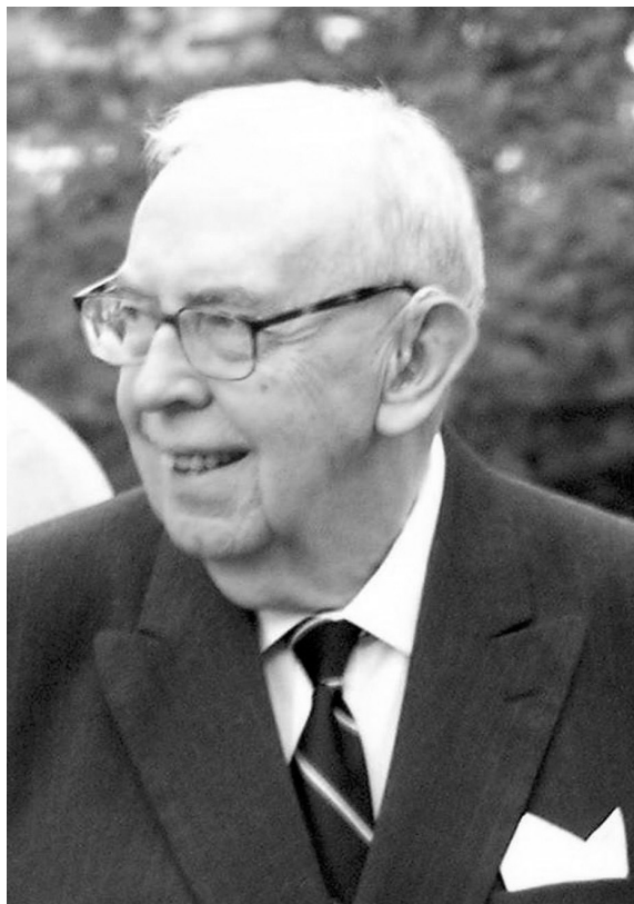
25. Krzysztof Skubiszewski, były Minister Spraw Zagranicznych RP, 20 sierpnia 2005 r.