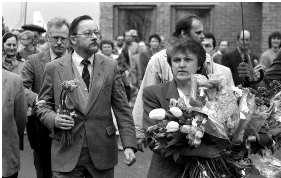
17. Przywitanie powracającej z wizyty w Warszawie premier Kazimiry Prunskienė, po lewej – przewodniczący litewskiego parlamentu – Vytautas Landsbergis, lotnisko w Wilnie, maj 1990 r.