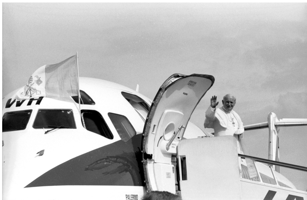
11. Początek wizyty apostolskiej Jana Pawła II na Litwie, lotnisko w Wilnie, 4 września 1993 r.