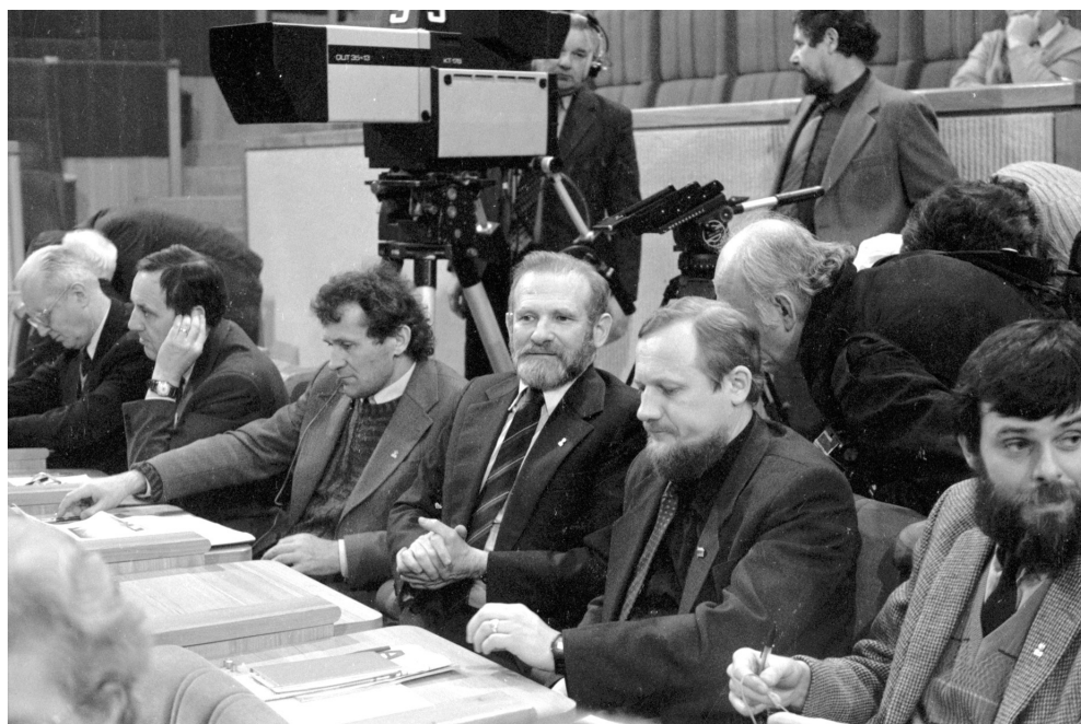
8. Delegacja polskich parlamentarzystów w sali obrad litewskiej Rady Najwyższej w Wilnie, trzeci od prawej – Bronisław Geremek, przewodniczący delegacji i przewodniczący sejmowej Komisji spraw zagranicznych; drugi od prawej – Vidmantas Povilionis – członek Komisji spraw zagranicznych w litewskiej Radzie Najwyższej, 27 marca 1990 r..