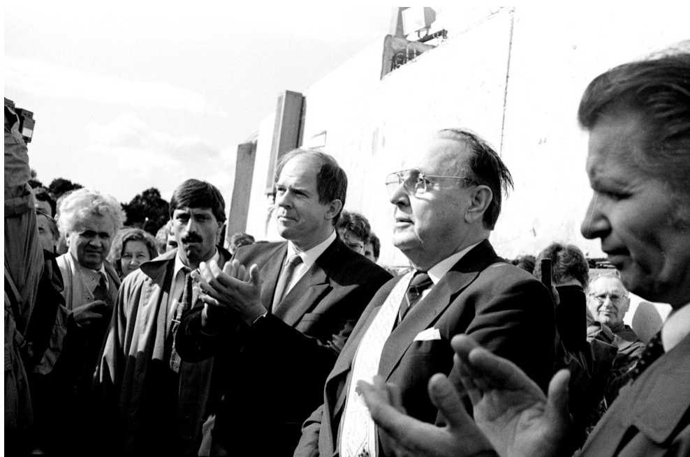
19. Wizyta ministra spraw zagranicznych RFN – Hansa-Dietricha Genschera na Litwie. Po lewej stronie niemieckiego ministra stoi minister spraw zagranicznych Litwy – Algirdas Saudargas, 12 września 1991 r.