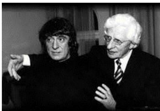
5 pav. Vytautas Barkauskas ir Jurijus Bašmetas

Vienas reikšmingiausių ne tik lietuvių muzikos sąrašė, bet ir V. Barkausko kūryboje yra Koncertas altui su kameriniu orkestru op. 63, kuris 1981 m. buvo parašytas ir dedikuotas žyriam altininkui Jurijui Bašmetui (Bašmetas buvo pirmasis atlikėjas bei alto solo partijos redaktorius). Šis kūrinys tarsi apibendrina kompozitoriaus paieškas ir akcentuoja emocinį, romantiinį pradą, kuris laikui bėgant sustiprėja V. Barkausko kūryboje. Tuo pat metu muzikos kalba tampa labiau prieinama ir aiški, ankstesnis grafiškumas dabar vis labiau susiderina su skambėjimo spalvingumu. Visi šie bruožai liudija apie Barkausko siekimą giliau pasinerti iš išreikšti raiškos priemonių sintezę gilinantis į turinio reikšmę.