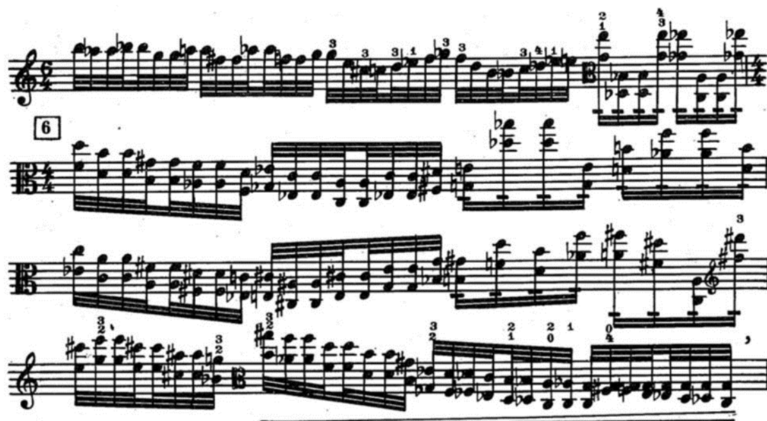
10 pav. V. Barkausko Koncertas altui ir kameriniam orkestrui II d. (kulminacija)

II d. Largo – tarsi variacija. Daugiausia solisto atliekama, pagrindinė tema, yra sudaryta iš trijų frazių, atskirtų cezūromis, kur pirmoji yra tema, o kitos dvi- jos variacijos, kurios prailginamos po vieną taktą. Ši dalis išsiskiria savo melodingu emocionalumu ir plačiu dainingu ir darniu alsavimu. Jausminga alto melodija, kuriai pritaria klavesinas tarsi nukelia į Naujiesiems laikams būdingą operos rečitatyvą.