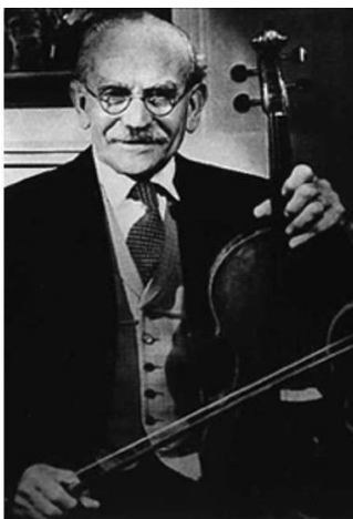
2 pav. Lionelis Tertis

Anglų altininkas L. Tertis – pirmasis altininkas solistas, pelnęs pasaulinį pripažinimą, įteisino šį instrumentą koncertinėje estradoje kaip lygiavertį ir pilnateisį. Jo meistriškas kūrybiškas atlikimas paskatino kompozitorius daugiau kurti altui. Alto repertuaras pasipildė daugiau nei 200 kūrybiškų altui arba ansambliams kuriuose yra altas. Taip pat pasaulinio garso anglų altininkas – W. Primrose’as žymus ne tik kaip atlikėjas ir pedagogas, bet ir savo išskirtinėmis, netradiciškomis kūrybiškų redakcijomis. Rusų alto mokyklos pradininkas – V. Borisovskis. Itin reikšminga jo veikla – transkripcijos altui, net apie 300, tarp kurių ir B. Dvariono „Tema su variacijomis fagotui ir fortepijonui“ transkripcija altui. Kiek vėliau XX a. antroje pusėje pasirodė daug žymių altininkų – Luigis Albertas Bianchis. Bruno Giurannas, Rivka Golani, Jurijus Bašmetas, Tabea Zimmermann, Nobuko Imai, Kim Kashkashian, Géraldas Caussé, Michaelis Kugelis, Maksimas Rysanovas, sąlygoję reikšmingą kūrėjų indėlį plečiant alto repertuarą bei naujų kūrybiškų šiam instrumentui atsiradimą. 11