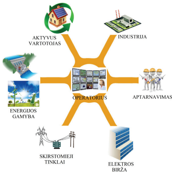
1 pav. Išmaniojo tinklo koncepcija

Taigi išmanusis tinklas turi pasižymėti tinklo faktinės būsenos nustatymo ir tam tikrų parametrų valdymo galimybėmis. Šiam tikslui yra būtina sukurti ryšių infrastruktūrą, kuri būtų skirta abipusiam komunikavimui tarp išmaniųjų matavimo įrenginių ir vartotojų bei tinklo operatoriaus. Taip pat yra būtina įdiegti tinklo valdymo sistemą, leidžiančią energijai tinkle tekėti abejomis kryptimis. Vienas pagrindinis išmaniojo tinklo sistemos dalis yra aktyvus vartotojas, kuris gyvena automatizuotoje aplinkoje, t. y. išmaniajame name, biure, laboratorijoje, mažajame tinkle, mieste, regione.