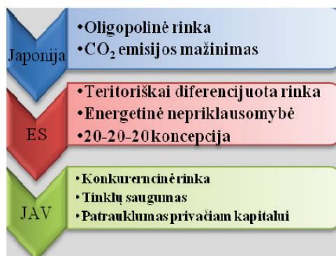
2 pav. Tinklų modernizavimo prioritetinės kryptys