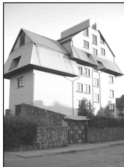
1 pav. Įmantrių, svetimų architektūros formų pavyzdys

Siekiant regionalumo bruožų reikia ne tik išsaugoti tai kas palikta ankstesnių kartų, bet ir toliau tęsti susiklosčiusias tradicijas. Dažnai sakoma, kad tautinio architektūros meno idėja