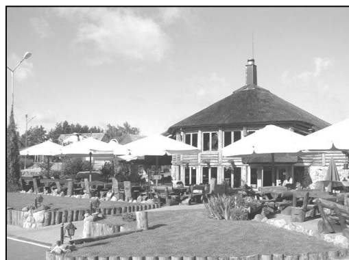
2 pav. Viena iš rekreacinės architektūros pavyzdžių

Rekreacinė aplinka yra išsidėsčiusi skirtingose geografinėse vietose visoje planetoje ir lemia architektūros regionų savitumą, kompozicinius ir funkcinis bruožus. Tačiau pasaulinė patirtis atskleidžia labai problemišką ne tik šiandieninės architektūros, bet ir kraštovaizdžio situaciją. Turizmas, kaip prigimtinis žmogaus poreikis, kuris kyla iš smalsumo ar domėjimosi kitomis kultūromis, yra laikomas XX a. fenomenu, virtusiu reikšmingiausia pramonės šaka. Šiandien, kaip niekuomet anksčiau, žmonės daug keliauja, atostogauja ir poilsiauja įvairiuose pasaulio kurortuose, rekreacinėse zonose. Kelius tam atvėrė technikos atradimai, ypač komunikacijų srityje, turizmo plėtrą skatina kylantis visuomenės kultūros, ekonomikos lygis, greitas pramoniniu miestų augimas, oro ir vandens užterštumas, įtemptas gyvenimo būdas [28].