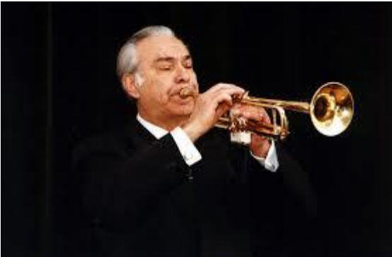
pav. 6 Timofėjus Dokšizeris

19 Timofėjus Dokshizeris (1921 m. gruodžio 13 d., Nežinas, Ukraina – 2005 m. kovo 16 d., Vilnius, Lietuva) – vienas iškiliausių XX amžiaus trimitininkų, taip pat žinomas kaip talentingas dirigentas ir ilgametis pedagogas. Jis laikomas viena svarbiausių figūrų ne tik Rusijos, bet ir visos pasaulinės pučiamųjų instrumentų muzikos istorijoje. Kilęs iš nepasiturinčios žydų šeimos, jis anksti susidūrė su gyvenimo sunkumais, tačiau jo muzikinis talentas buvo pastebėtas jau vaikystėje.