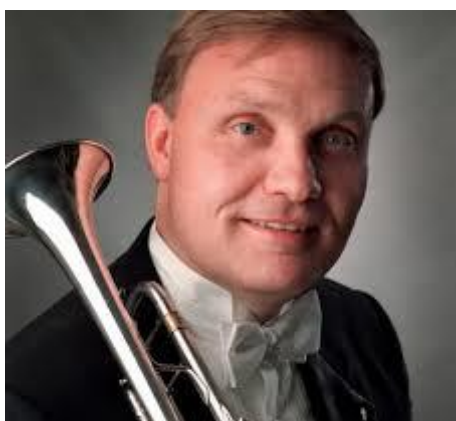
pav. 7 Philipas Smitas