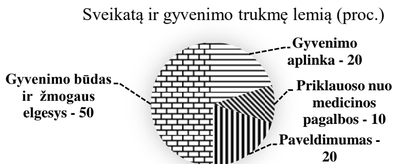
2 pav. Sveikatą ir gyvenimo trukmę lemiantys veiksniai

A. Skurvydas (2006) išskyrė veiksnius lemiančius sveikatą ir gyvenimo trukmę (žr. 2 pav.).