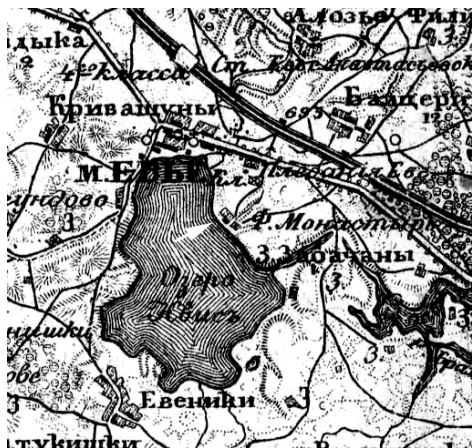
1 pav. Vievio vienuolyno vieta XIX a. antrosios pusės topografiniamė žemėlapyje (Ф. Монастырь)

Petrauskų sodyba yra Vievio ežero krante, 1 km į pietryčius nuo Vievio bažnyčios, 0,8 km į pietus nuo kapinių ir 0,3 km ta pačia kryptimi nuo miesto stadiono. Sodybos daržai vakarų kryptimi leidžiasi į ežerą. XIX a. antrosios pusės žemėlapiai šioje vietoje žymi Vienuolyno vardu vadinamą palivarą (Ф. Монастырь) (1 pav.). Greta Petrauskų stovintis Grigonių gyvenamasis namas apie 1942 m. buvo pastatytas ant praeityje veikiausiai dar vienuolyno laikais išmūryto akmenų ir plytų mūro rūsio, kuris pagal paskirtį yra naudojamas iki šiol. Eugenijus Petrauskas saugo įvairių savo sodyboje rastų, XVI–XVIII a. apyvarčio buvusių monetų: sidabrinį Aleksandro pusgrašį, keletą varinių Jono Kazimiero šilingų, Gustavo Adolfo Rygos miesto šilingą ir kai kurias kitas. Dalį numizmatinių ir kitų radinių radėjas jau