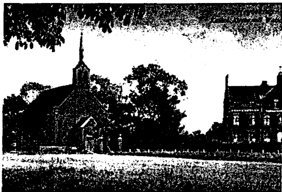
6 pav. Žibų bažnyčia