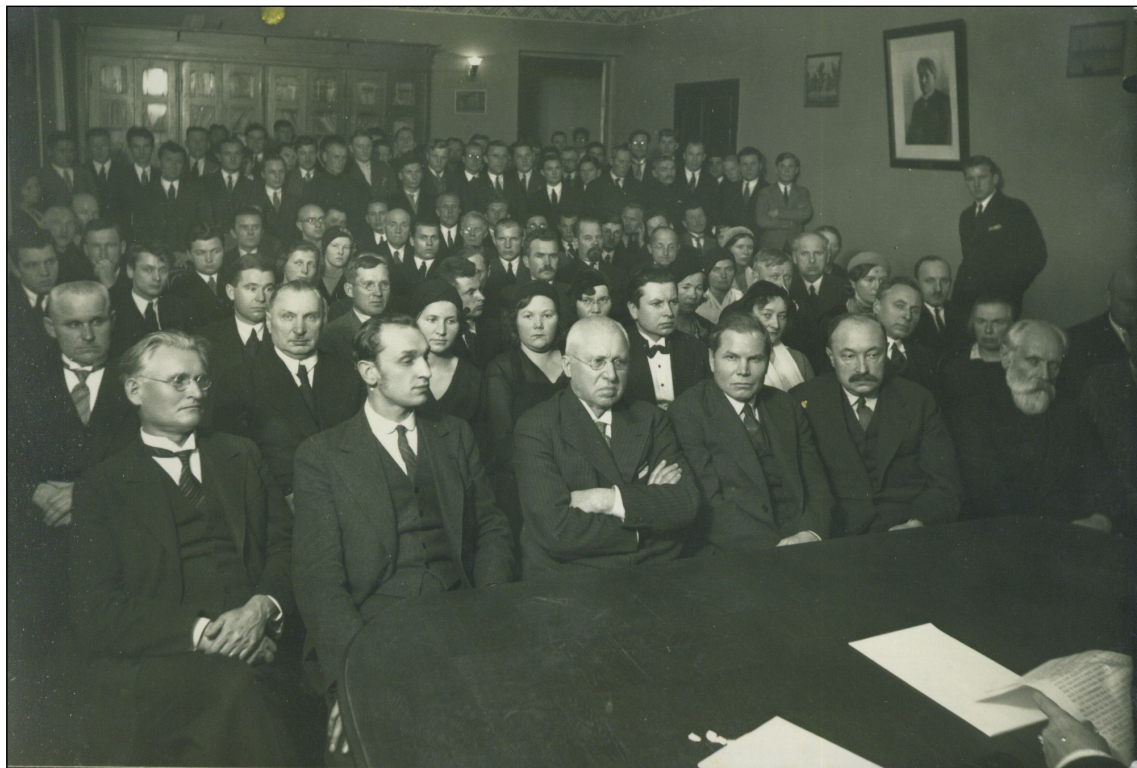
1 il. 4-ojo dešimtmečio pirmoje pusėje vykusiame LVLS visuotiniame metiniame atstovų suvažiavime Justas Paleckis (antras iš kairės) sėdi pirmoje eilėje greta senųjų valstiečių liaudininkų lyderių Kazio Griniaus (pirmas iš kairės) ir Mykolo Sleževičiaus (penktas iš kairės).