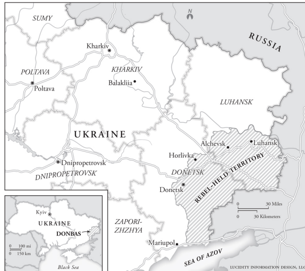
3 pav. Prorusiškų separatistų kontroliuojamos Pietryčių Ukrainos teritorijos. Šaltinis – Eastern Ukraine: Different Dynamics. Carnegie Europe 95 .

belaisvę paimtus Rusijos karių 94 . Tokie ryžtingi veiksmai užkirto kelią prorusiškų separatistų įsitvirtinimui Dniepropetrovsko mieste ir srityje. Taip pat reikia atkreipti dėmesį į tai, kad ši Ukrainos sritis nesiriboja su Rusija (žr. 3 pav.), tad tiesioginė Rusijos parama separatistams buvo ženkliai apsunkinta. Kitas svarbus faktorius, kurį reikia paminėti, yra susijęs su gan menka parama V. Janukovičiaus „Regionų partijai“ ir kitiems prorusiškiems politiniams judėjimams šiame regione.