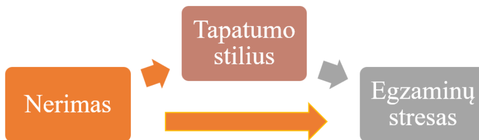
2 paveikslas. Hipotetinis reiškinių prognozių ryšių modelis

Remiantis išvadomis, padarytomis analizuojant skirtingų tyrėjų duomenis, prognostinius reiškinius siejančius ryšius bus siekiama patikrinti pagal 2 paveiksle darbo autorės pateiktą modelį.