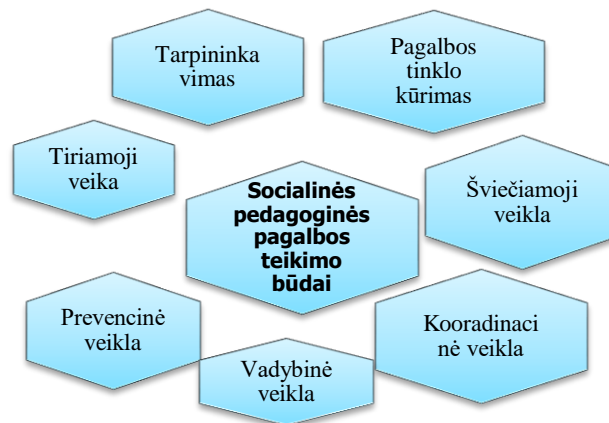
2pav. Socialinės pedagoginės pagalbos teikimo būdai. Sudaryta darbo autorės.

Dokumentas reglamentuojantis socialinio pedagogo veiklą yra Lietuvos Respublikos Švietimo 2016 m. lapkričio 2 d. Įsakymas dėl mokyklos socialinio pedagogo pavyzdinio pareigybės aprašo patvirtinimo Nr. V-951, kuriame nurodoma: