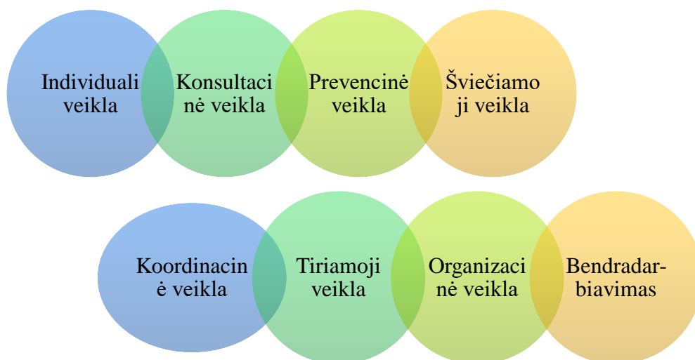
4 paveikslas. Socialinio pedagogo vykdomos veiklos ikimokyklinėje ugdymo įstaigoje. Sudaryta darbo autorės.

Apibendrinant tyrimo dalyvių pateiktus atsakymus galima išskirti veiklas, kurias vykdo socialiniai pedagogai ikimokyklinėje ugdymo įstaigoje: