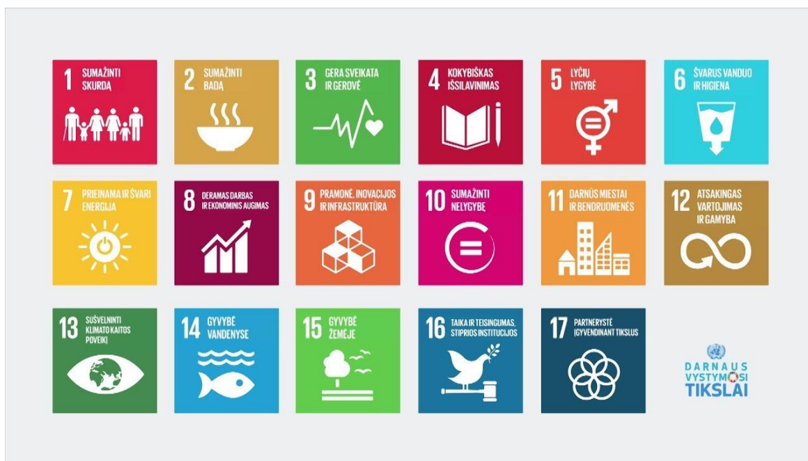
1 pav. Darnaus vystymosi tikslai

Rio+20 konferencijos išvados „Ateitis, kurios norime“. Šiomis išvadomis buvo patvirtinti darnaus vystymosi įsipareigojimai, sustiprinta tarptautinė darnaus vystymosi politikos formavimo sistema ir pradėtas naujos darnaus vystymosi darbotvarkės rengimas. 2015 m. Jungtinių Tautų vystymosi darbotvarkėje patvirtinta 17 universalių, pasaulinių ir tarpusavyje susijusių darnaus vystymosi tikslų(žr. 1 pav.).