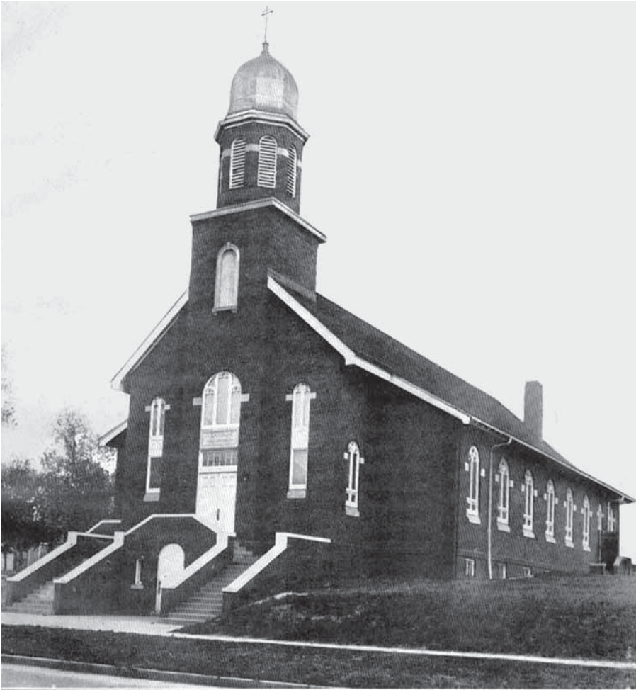
2 pav. Šv. Kazimiero bažnyčia Sioux City mieste Ajovos valstijoje