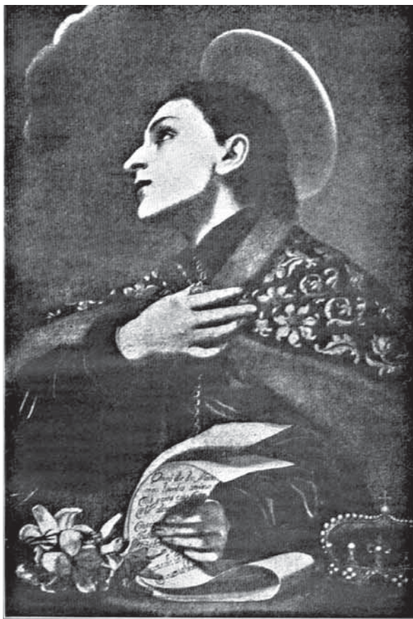
SVENTAS KAZIMIERAS, LIETUVOS GLOBEJAS SAINT CASIMIR