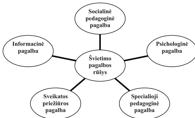
1 pav. Švietimo pagalbos kryptys

Lietuvos Respublikos Švietimo įstatyme (2003) traktuojama, jog švietimo pagalba – tai specialistų, teikiama pagalba mokiniams, jų tėvams (globėjams, rūpintojams), mokytojams ir švietimo teikėjams, leidžianti padidinti švietimo veiksmingumą. Švietimo pagalbos kryptys pateiktos 1 pav.