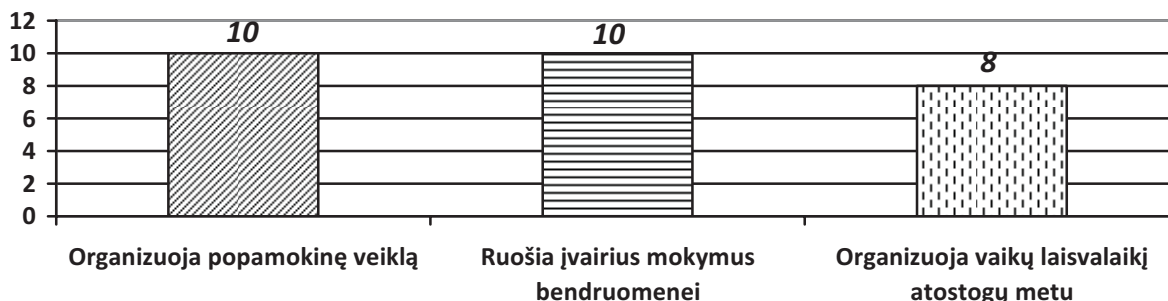
2 pav. Papildomai teikiamos socialinės paslaugos ir jų pasiskirstymas Kretingos rajono kaimo filialuose

Nors tik keletas analizuojamo Kretingos rajono kaimiškosios bibliotekos yra vietovėse, kuriose juridškai įregistruotos bendruomenės, beveik visi filialai teikia papildomas socialines paslaugas vietos gyventojams. Tai patvirtina bibliotekos reikšmę mažose bendruomenėse, tuo pačiu praplečia bibliotekos institucinės veiklos sampratą. Anketoje atskiru klausimu siekta išsiaiškinti, kokias socialines paslaugas teikia Kretingos rajono kaimiškieji filialai. Išskirtos trys pagrindinės paslaugų grupės – popamokinės mokinių veiklos organizavimas, mokymai bendruomenei ir vaikų laisvalaikio organizavimas atostogų metu. Apibendrinti duomenys pateikiami antrame paveiksle.