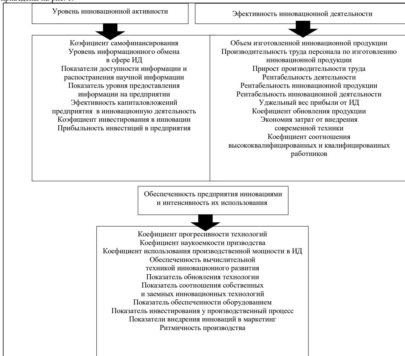
Рис. 1. Показатели расчета определенных параметров общего уровня инновационной деятельности на промышленном предприятии

Эффективность инновационной деятельности предусматривает определение способности предприятия к производству инновационной продукции и характеризуется анализом темпов производства новой продукции, определением целесообразности производства той или другой продукции, необходимостью направления средств в инновационное развитие, эффективности работы маркетинга по сбыту определенного типа и вида продукции, размеров дохода от результатов инновационной деятельности (ИД) и выручки от реализации инновационного типа продукции, суммы расходов на проведение ИД. За приведенной группой существуют возможности относительно оценки уровня поддержки государством инновационной деятельности предприятий и основные показатели приведены на рис. 1.